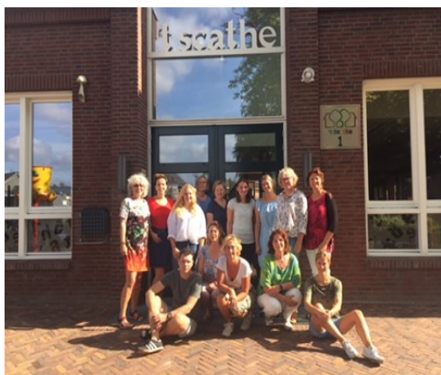
Teamfoto 't Scathe augustus 2018